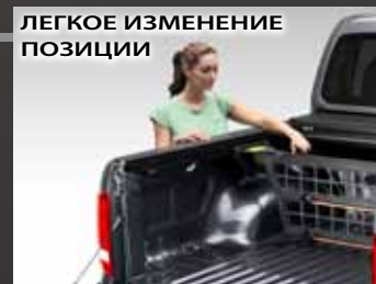
ЛЕГКОЕ ИЗМЕНЕНИЕ ПОЗИЦИИ